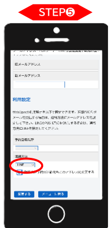
【利用設定 画面】 連絡方法に「LINE」を選択