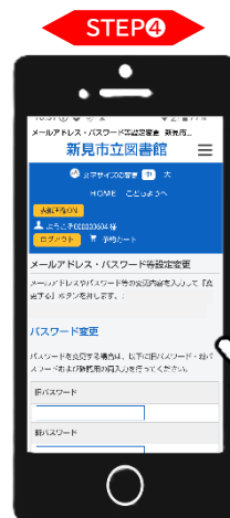
【メールアドレス・パスワード・LINE等設定変更 画面】 画面を下スクロール