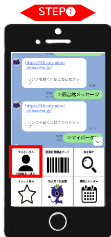
「マイポータル」をタッチ