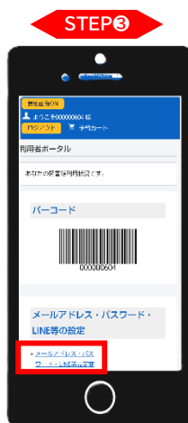
【利用者ポータル 画面】 「メールアドレス・パスワード・LINE等設定変更」をタッチ