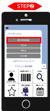
「図書館利用券」をタッチ